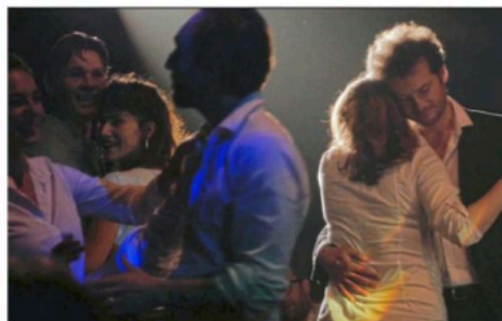
L'action est itinérante et se déplace aux quatre coins du théâtre.

mier temps. Ici, la frontière entre la scène et le public est effacée comme par magie. L'action est itinérante, elle se déplace aux quatre coins du théâtre, fait irruption au milieu du réel comme des bulles de champagne.